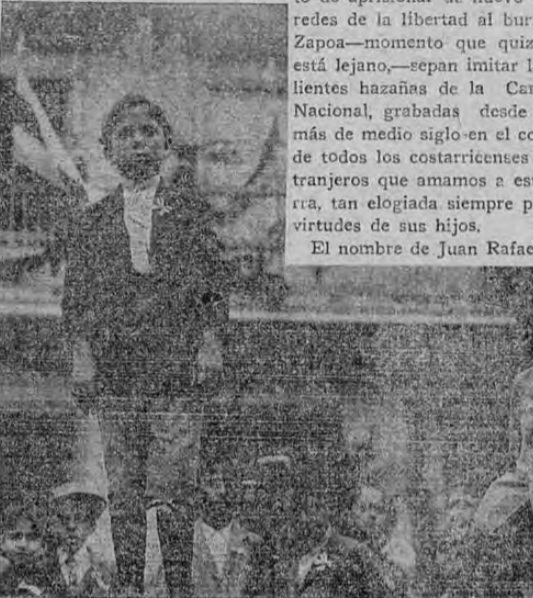
El niño Corrales pronunciando su discurso

A las 8 de la mañana el público invadió los corredores principales del edificio. En el corredor del norte se levantó la tribuna o